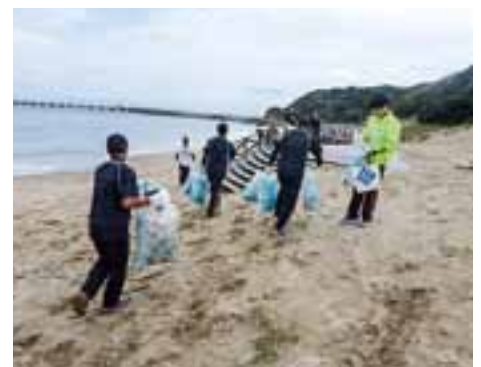
スポーツGOM拾いの状況 (平成27年11月8日、北九州脇田海岸)